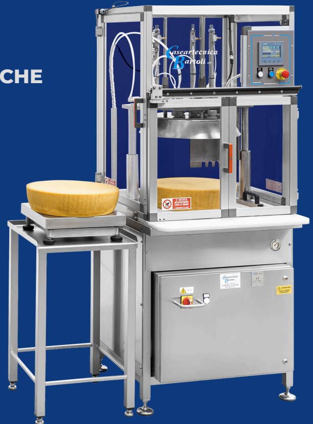
ROCK 20 PLUS STANDARD