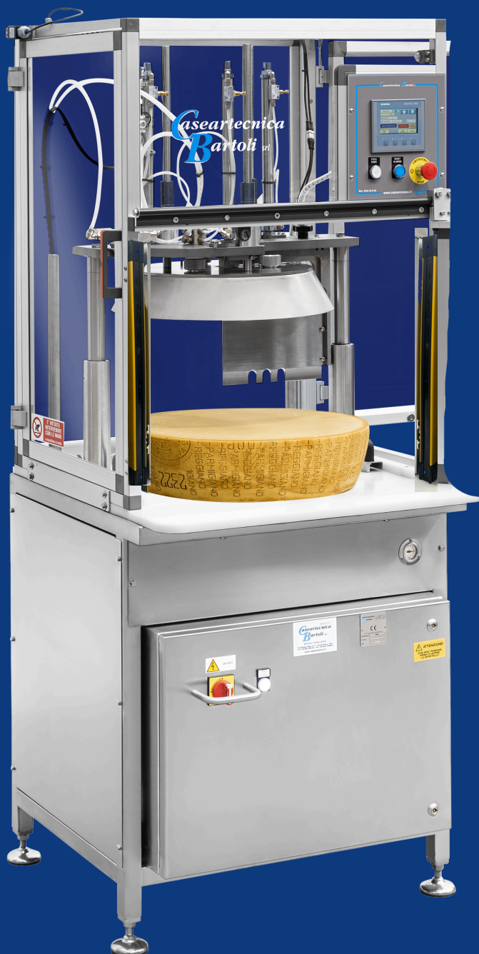
ROCK 20 PLUS CON BARRIERE OTTICHE